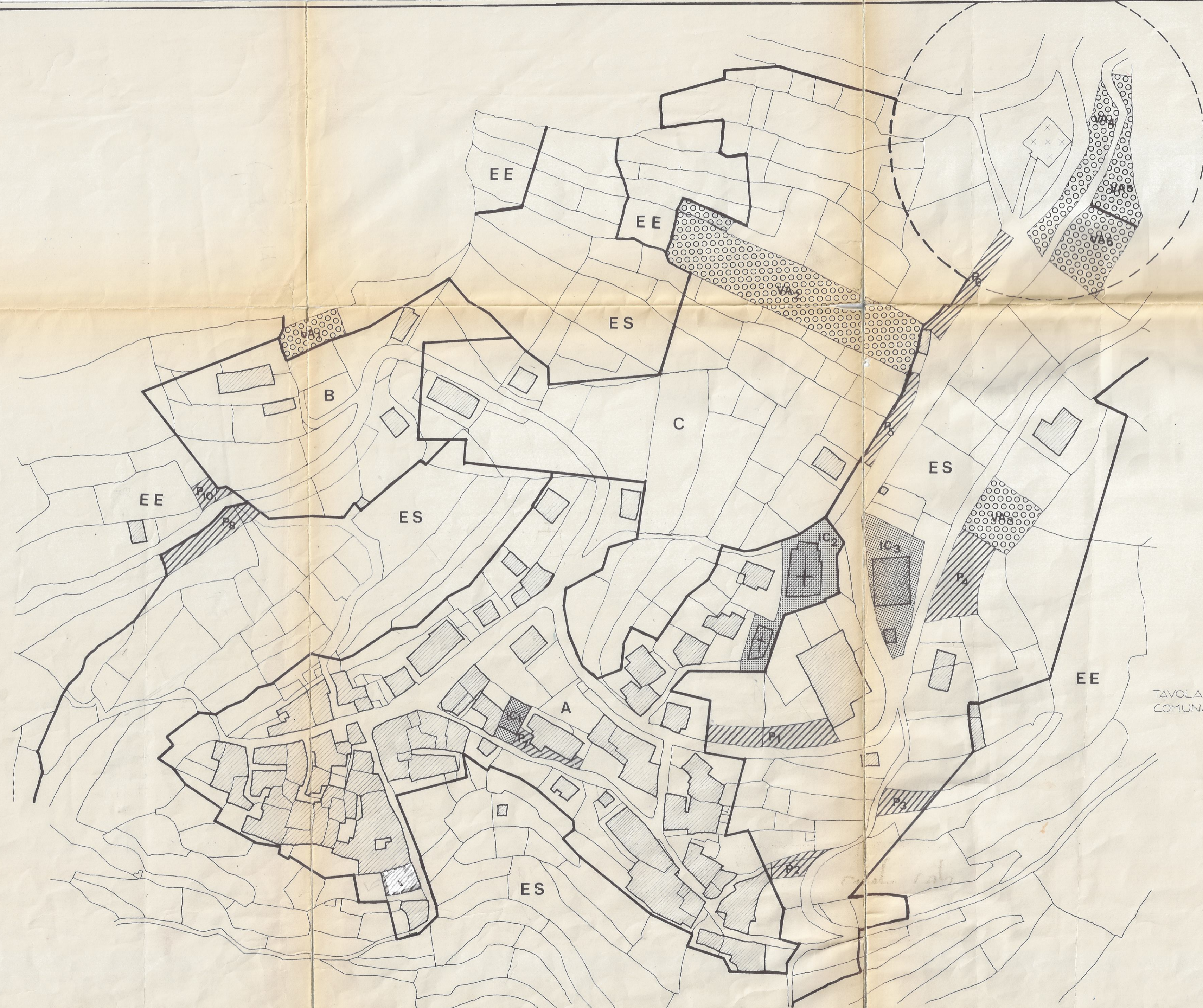
TAVOLA MODIFICATA NEL CONSIGLIO COMUNALE DEL 24-02-97