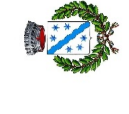
TAVOLA 4 GEO Scala 1:10.000 Data novembre 2023

COMUNE DI BORGHETTO D'ARROSCIA Provincia di Imperia PIANO URBANISTICO COMUNALE ai sensi dell'art. 5 della L.R. 36 / 1997